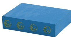
CM Ex ソリッド コンペンセーション